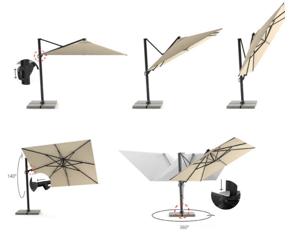
ANTARES AMPELSCHIRM 3.0X3.0M ECKIG